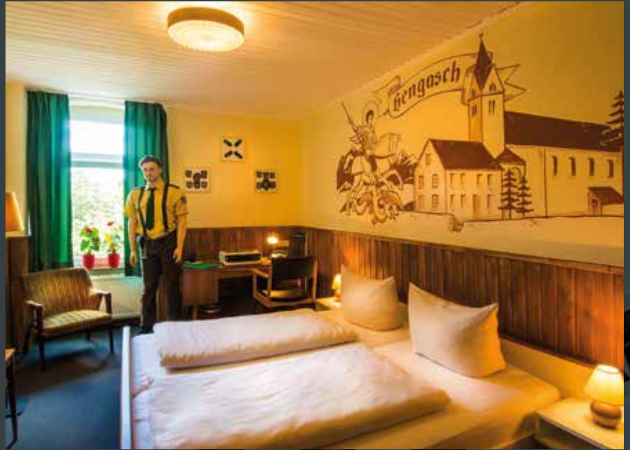
Hier sind Sie sicher ... im „Revier Hengasch“