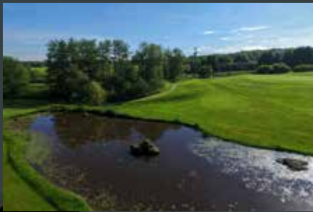
Golfbahnen zum Verlieben