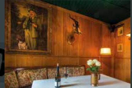
„Schießen“ Sie bei einem Glas Rotwein Ihr Fanfoto!