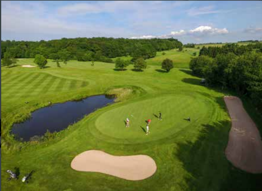
Wo Golfen Urlaub ist